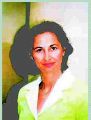
Ségolène ROYAL, Ministre déléguée à l'Enfance et aux familles

Un autre ministère, pendant ce temps, dort tranquillement sur les projets de réformes, pourtant vitales, du Droit de la Famille, après la fuite de sa Ministre, du ministère de la Justice vers celui de la Solidarité; aveu d'impuissance devant les blocages ou les pressions menaçantes des lobbies anti-père ou bien manque de détermination politique ?